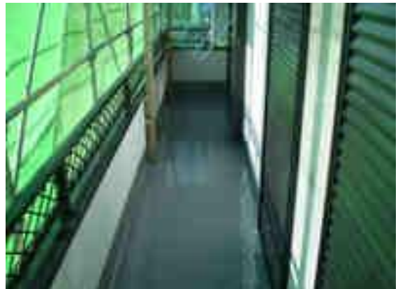
ベランダウレタン防水