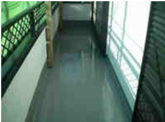
ベランダウレタン防水1